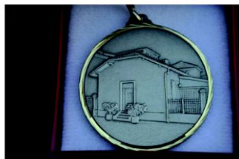
La medaglia del Centenario consegnata a tutti i soci

Gli edifici si trovano in via Pirovano, zona centralissima di Barzanò, a poco più di cento metri dal Municipio e dalla Piazza del Mercato. Fondata nel 1913 nei suoi locali in un secolo di vita si è svolta una intensa attività sociale, ricreativa e culturale. Oggi i locali sono stati dati in uso all'Associazione Pensionati Barzanesi, alla Bocciofila Luciano Manara e anche a una scuola elementare.